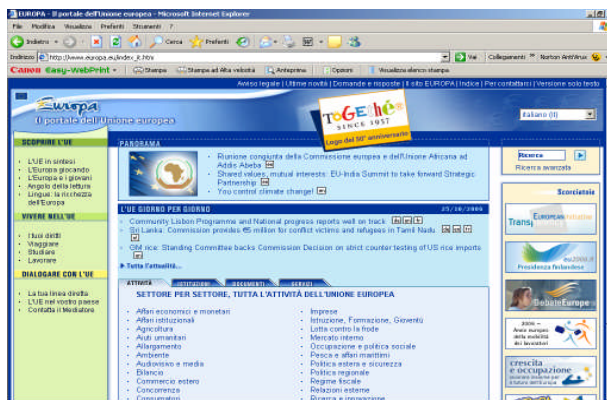
Clickando su IT si accede all'home page