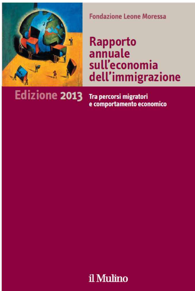
Rapporto Annuale sull'Economia dell'Immigrazione