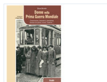
Donne Nella Prima Guerra Mondiale