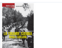
La Grande Guerra Degli Italiani