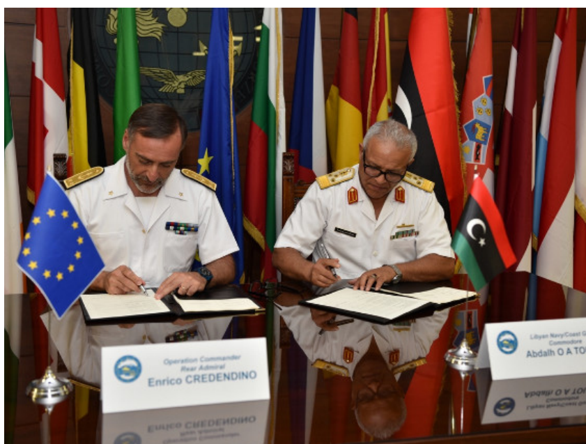
Operazione Sophia: firmato l'accordo per l'addestramento della Guardia Costiera e della Marina libica